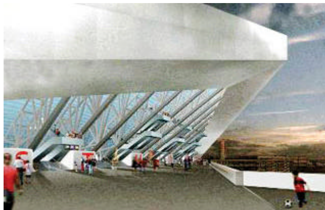
So soll dereinst der Eingangsbereich zum neuen Stadion aussehen.